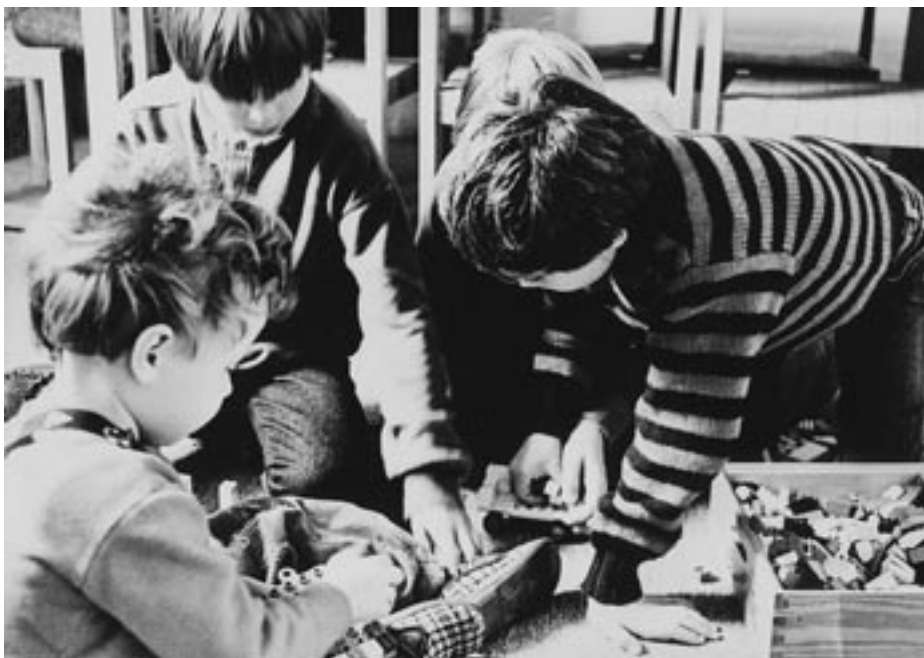
Leg med Duplo-klokker, ca. 1980.