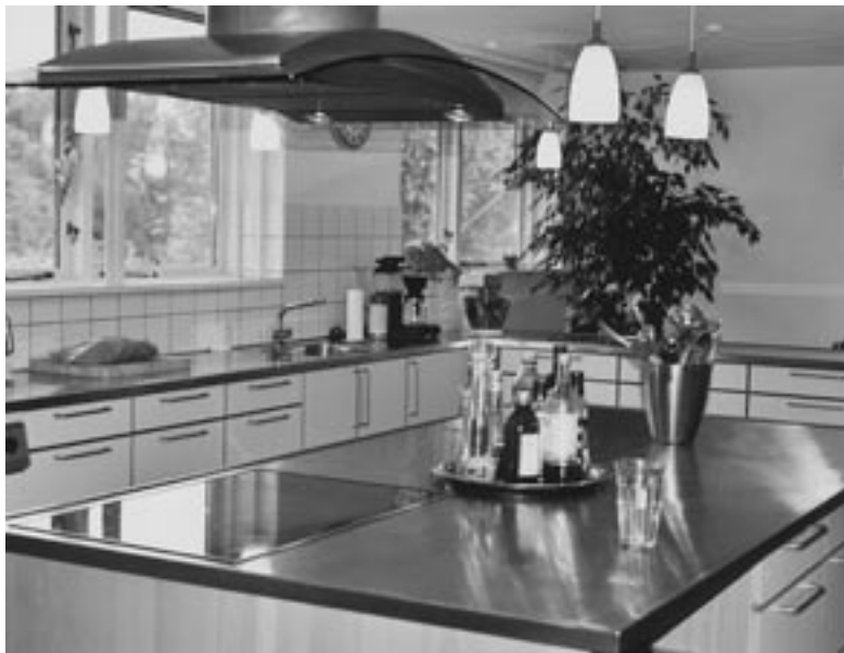
Foto: Haraldslunds køkken er det naturlige samlingssted. De, der ikke deltager i madlavningen, kan sidde ved et lille separat bord i selve køkkenet eller sidde i spisestuen, som i dag står i åben forbindelse med køkkenet. Et andet samlingssted er husets veludstyrede computerum, hvor der laves lektier, spilles pil o.s.v.

huset og sit værelse. Udslusningsafdelingen har desuden sin helt egen indgang.