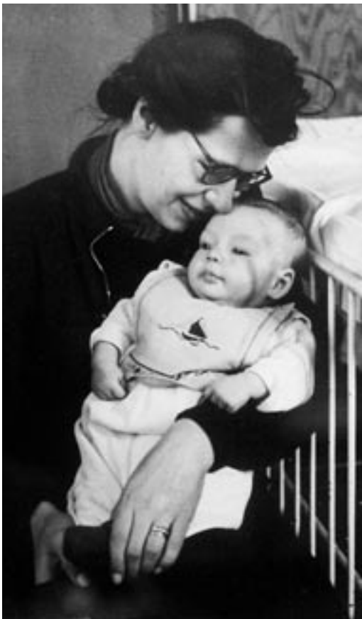
Det var og er stadig muligt for forældrene at besøge deres børn på hjemmet. Her er en mor kommet for at se til sin lille pige. 1941.