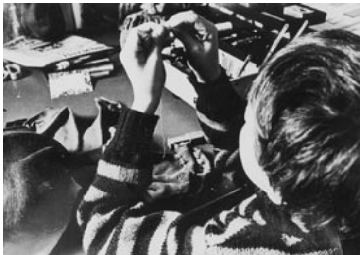
Børnene lærte at sy. Foto ca. 1980.

gået, sådan som det også var skik i de fleste ”normale” familier.