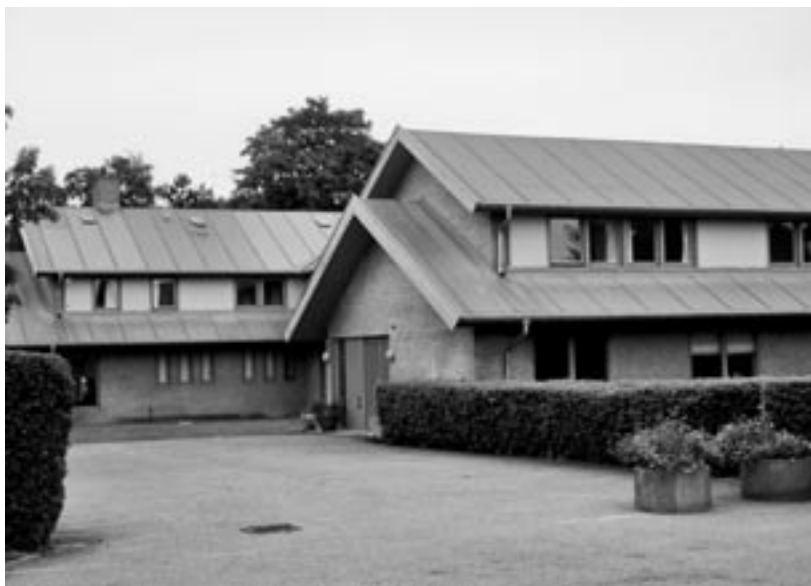
Haraldslund udefra i 2005.

Nødebogård. Og lad os også bare sige, at bestyrelsens beslutning om at overdrage stedet til amtet i 1986 viste sig at være både forudseende og fornuftig, selvom den i 1986 var unødvendig.