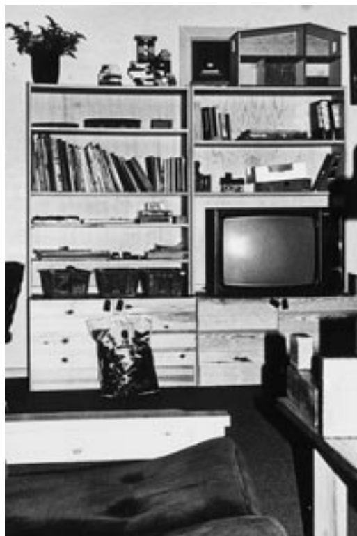
Opholdsstue ca. 1980.