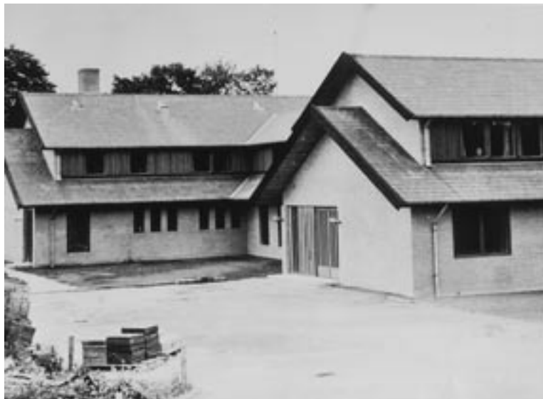
Det nybyggede Haraldslund, 1967.