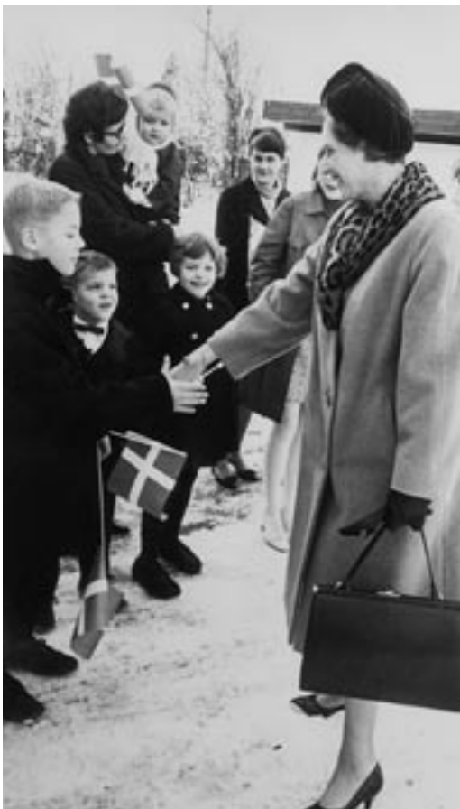
Indvielsen foregik 11/12-1967 med deltagelse af bl.a. arveprinsesse Caroline Mathilde, som her hilser på eleverne.

indflydelse på børnenes hverdag allerede fra 1960, var, at de begyndte at få lov til at gå til f.eks. dans eller spejder. Deres pligter i hjemmet blev ”normaliserede” i forhold til børns pligter i almindelige familier. Desuden blev det nu det helt normale at få besøg eller selv at tage hjem i weekenderne. Og havde børnene lyster og evner blev de fra nu af også opmuntrede til at videreudanne sig.