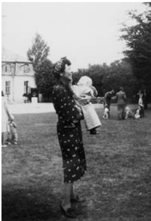
1941. Både forældre og plejeforældre kom og besøgte de mange børn. Det var altid glædeligt for begge parter at kunne få lov til at opleve hinanden.