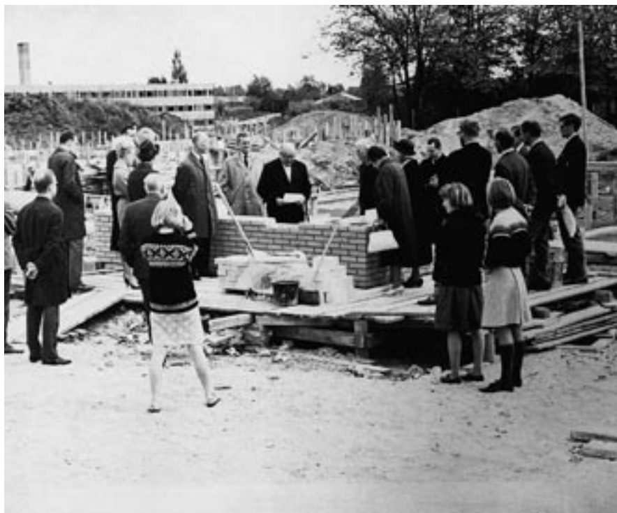
Ved grundstensnedlæggelsen i maj 1966 var også de store piger med.