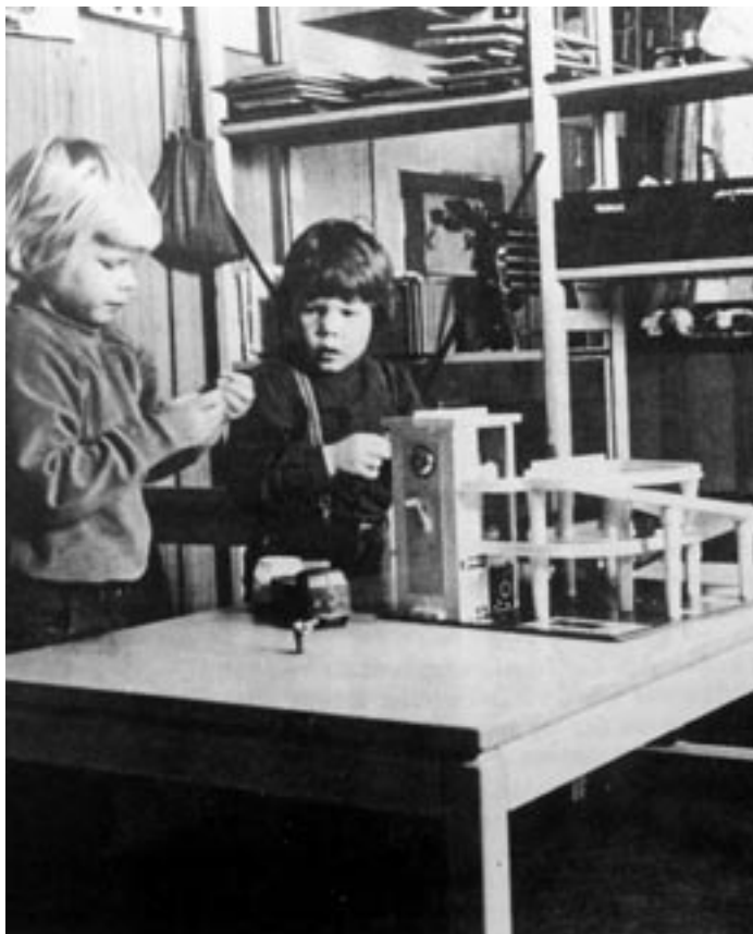
1980. De mange aktiviteter adspredte børnene i løbet af dagen. De har mange muligheder for at lege både sammen og hver for sig.

De største børn kan gå i ”børnehave” to formiddage om ugen på Bagsværd Observationshjem, hvor de laver kreative og skoleforberedende aktiviteter. Andre aktiviteter som f.eks. svømning eller ridning tilrettelægges efter barnets alder og interesse. De forskellige børnegrupper tager jævnligt på koloni. Turen går ofte til institutionens sommerhus i Munkerup, men kan også foregå i en hytte i Sverige, i Lalandia eller et andet sted valgt efter børnenes alder og ønsker.