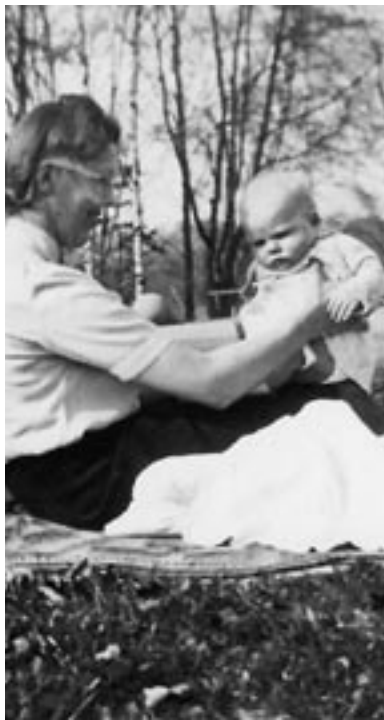
Sommeren 1945. En barneplejerske har taget et lille barn med ud på græsplænen for at nyde den varme sol.