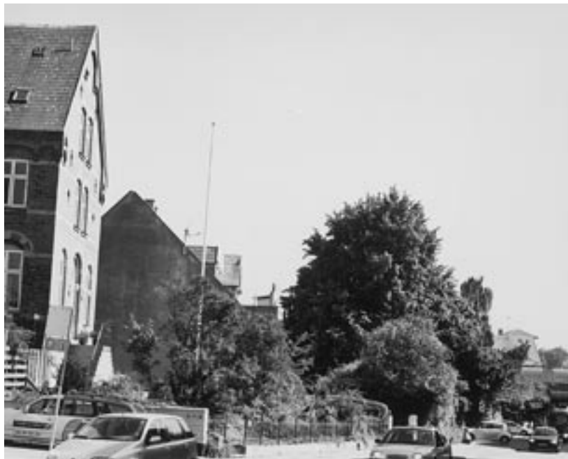
Selv på et nyt foto, kan man se, hvor tæt på Ove Hohlenbergs Minde, jernbanen løber. Det var en farlig sag at krydse sporene, da de løb tværs over Hellerupvej.