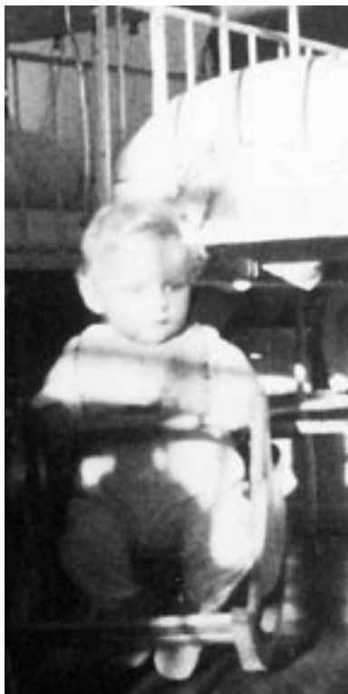
1946. Lille Pylle sidder alene på det bare gulv. Det skulle dog snart blive bedre med indførelsen af nye pædagogiske teorier.